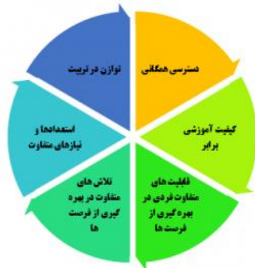
شکل 1 شش عنصر اصلی عدالت آموزشی

بندی رسید که بین شش عنصر کلیدی در عدالت آموزشی باید جمع کرد. این چند عنصر در سایر عرصه های اجتماعی غیر از آموزش نیز چالش ایجاد کرده- اند: